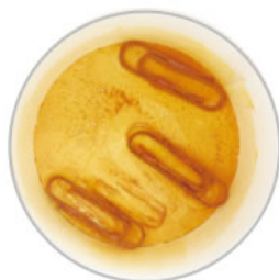
微酸性 次亜塩素酸水