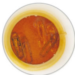
弱酸性 次亜塩素酸水