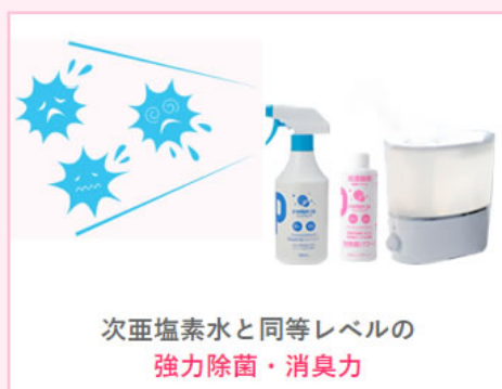
次亜塩素水と同等レベルの 強力除菌・消臭力