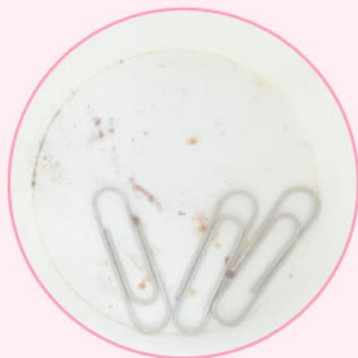
プレミアムジア (弱アルカリ性次亜塩素酸ナトリウム)