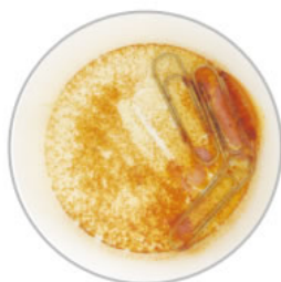
弱アルカリ性 次亜塩素酸ナトリウム

水の資質（酸性・アルカリ性）によってもサビの進行速度は異なります。 pHの低い酸性の方がアルカリ性よりもサビの進行速度は速く腐食しやすい特長があります。