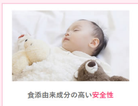
食添由来成分の高い 安全性

強力な除菌力、消臭力を発揮しながら「サビにくい、色落ちしにくい」を実現した最高品質の次亜塩素酸ナトリウムを使用。 100%食品添加物由来だから、人と環境にやさしく安心、安全な除菌・消臭剤です。